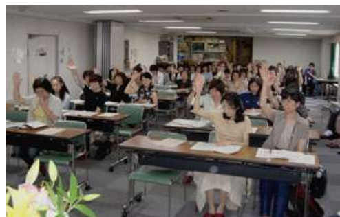
すべての議案が承認された

こうした社会を実現するために、たくさんの ワーカーズを作り、同じ思いを持った仲間を増 やし、地域社会と連携していきます。